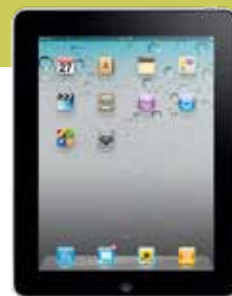
Arvottava palkinto on n. 800 euron arvoinen iPad.

Jokainen numero on uusi mahdollisuus osallistua!