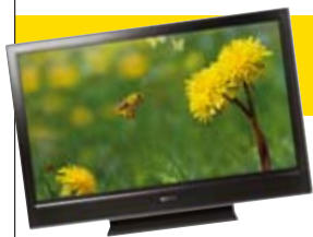
Arvottava palkinto on Sony:n testimenestystä, teräväpiirtovalmis KDL-32D3000 LCD-TV, jonka arvo on 1 090 €.

Samalla voit antaa aihe-ehdotuksia ja vaikuttaa lehden sisältöön. Vastaa heti lyhyeen kyselyyn osoitteessa www.mcipress.fi/lukijapalvelu